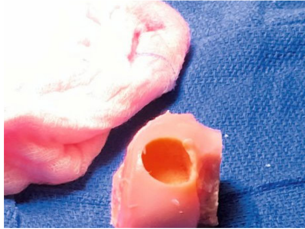
Abbildung 4 a–b Postop.: Gebrauchte Anker einer Meniskusnaht und verwendetes osteochondrales Allograft