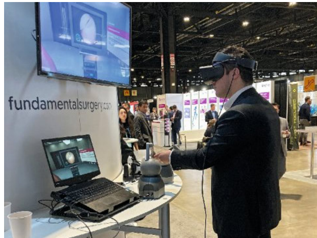
Abbildung 6 Auf dem neuesten Stand: Virtuelles Austesten einer OP-Technik im Rahmen des AAOS