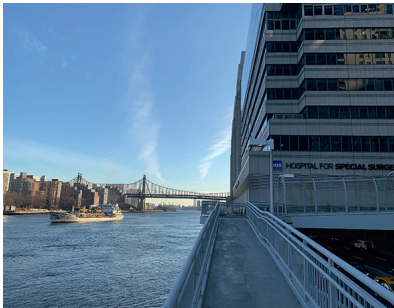
Abbildung 4 Blick auf den East River beim Hospital for Special Surgery in der 70th Street.