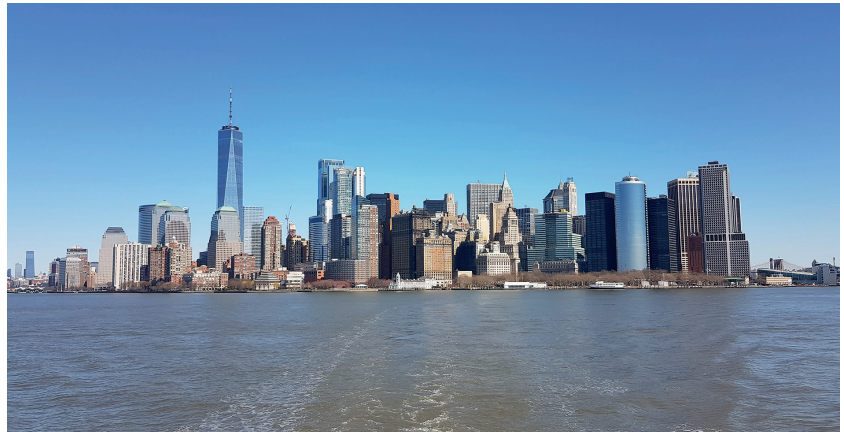
Abbildung 5 Blick auf die Skyline von New York City von der Fähre zur Liberty Island

thetik für Dr. Völlner). Angepasst durch unsere Vorerfahrung in Rochester, fielen der Arbeitsablauf und die Organisation im OP nicht mehr schwer. Auch hier wurde Medizin auf höchstem Niveau praktiziert. Besonders gefiel uns das konsequente debriefing durch den Operateur und das gesamte OP-Team, in dem sämtliche Punkte der Operation und Nachbehandlung besprochen wurden. Eine sinnvolle Ergänzung zum etablierten team-time-out vor Operationsbeginn.