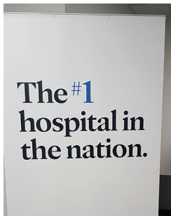
Abbildung 1 Ankunft am Flughafen in Rochester. Mayo Clinic No. 1.